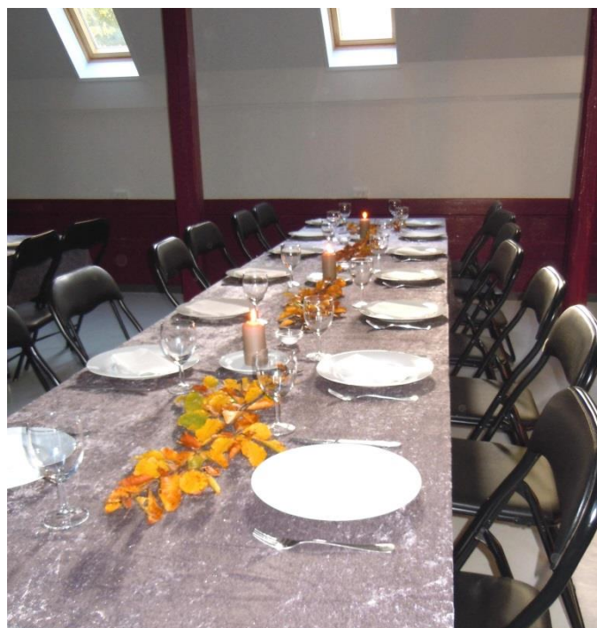
Eksempel på en privat fest, hvor klapstole fra depotmessen er bragt til mandskabsmessen

De gamle overheadprojektorer anvendes ikke mere. I dag ønskes mulighed for at kaste billeder fra de allesteds nærværende computere op på skærmen, hvad enten opgaven er foredrag eller underholdning. Derfor ønsker inspektionen at opsætte en god projektor, som kan anvendes i dagslys, i loftet, så det umiddelbart er muligt at trække et lærred ned og kaste briefing fra computeren op på skærmen via et fastmonteret mellemkabel - i lighed med andre gode auditorier. Hvad der vel burde være naturligt for akademikere, også når de er i felten.