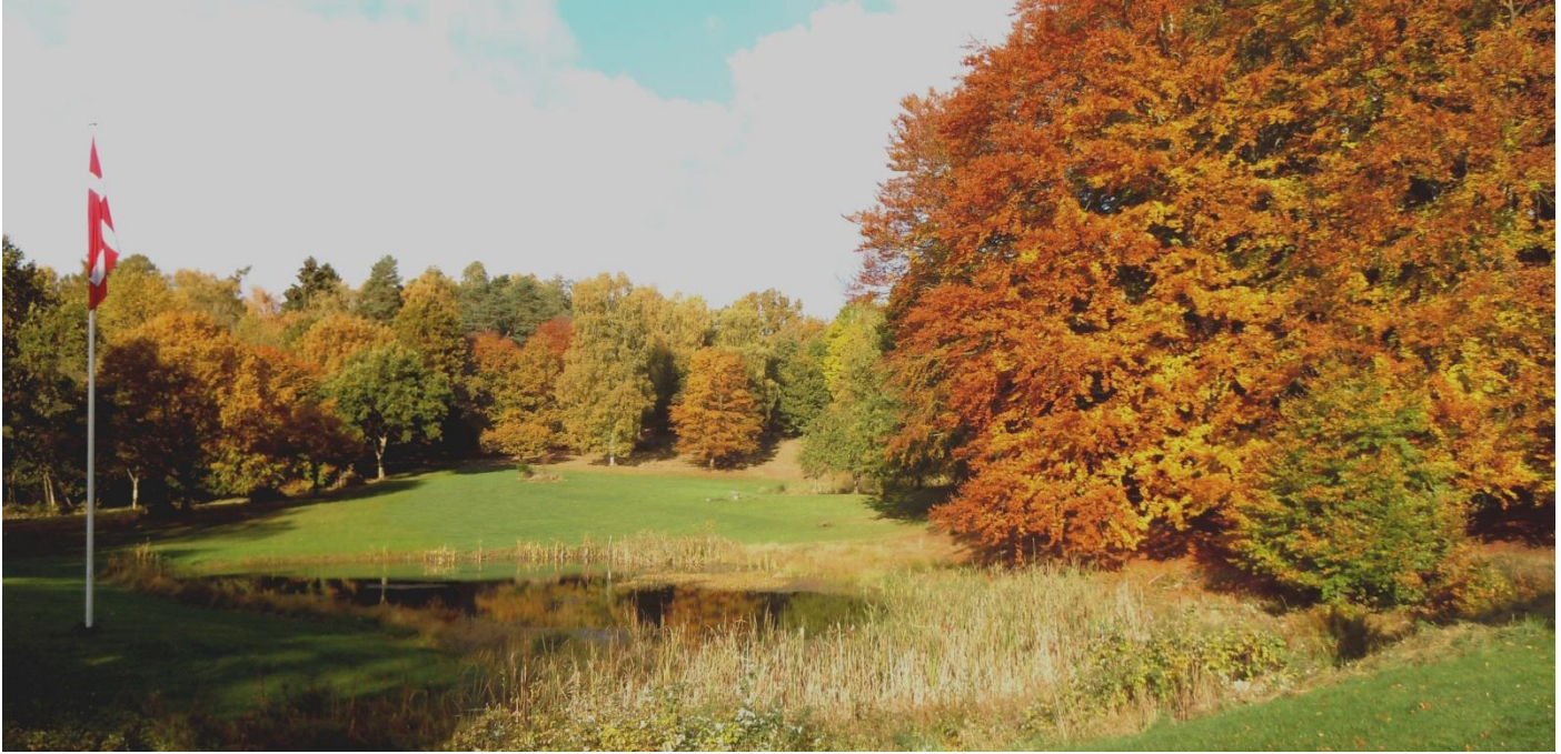
Efterårsfarver den 25. oktober